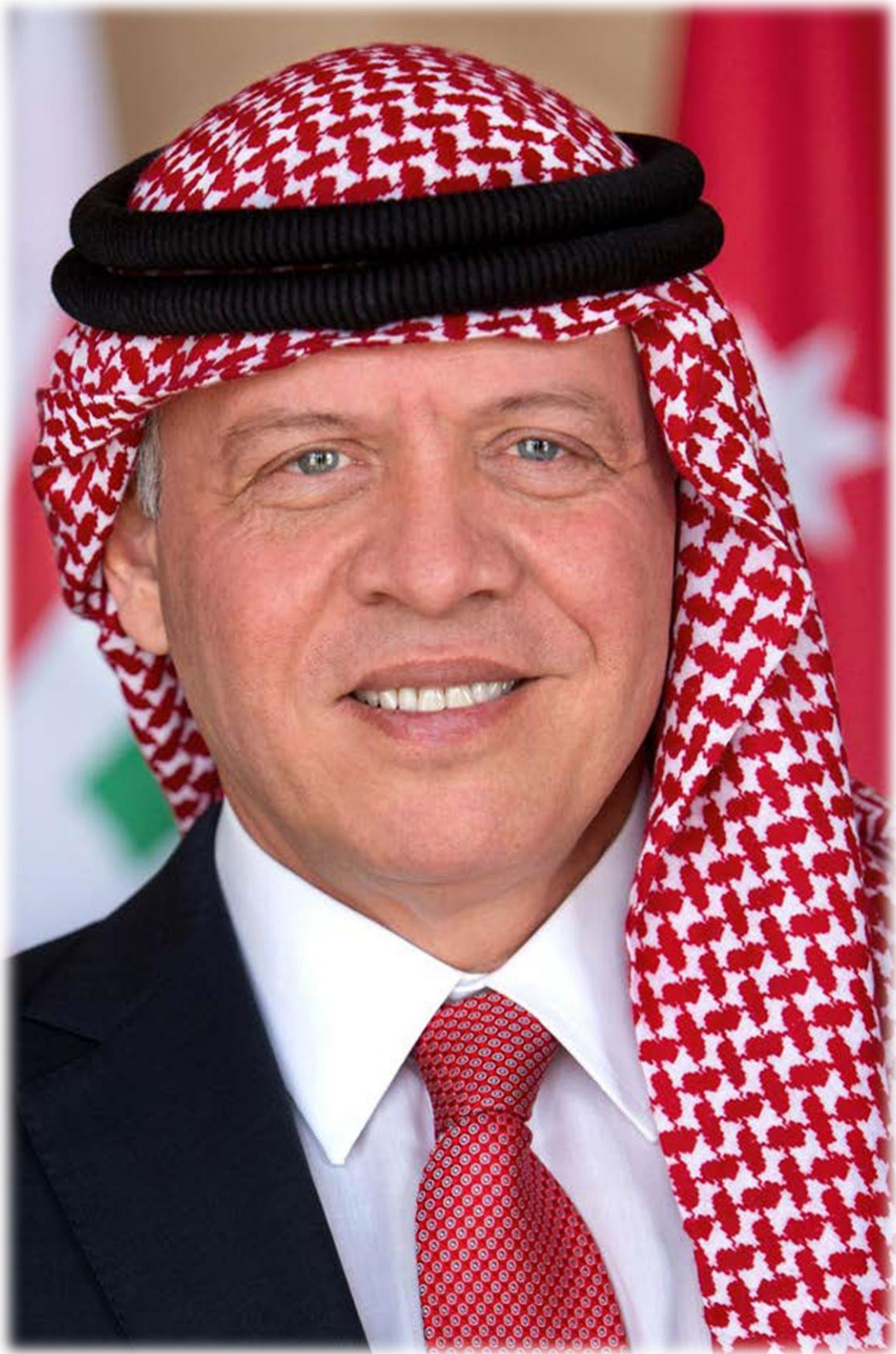
حضرة صاحب الجلالة الهاشمية الملك عبدالله الثاني بن الحسين المعظم