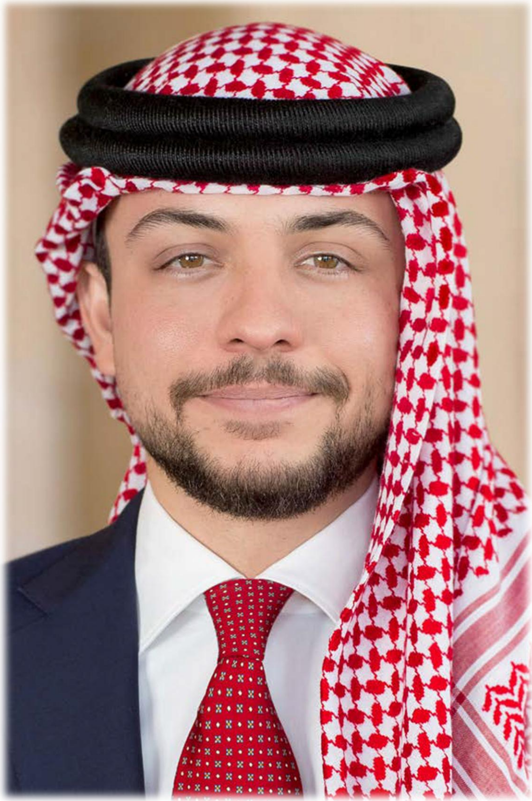
صاحب السمو الملكي الأمير الحسين بن عبدالله الثاني ولي العهد المعظم